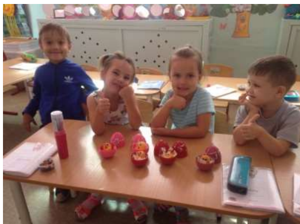
Изготовление поделок «Цыпленок в яйце» (Закирова И.А.)