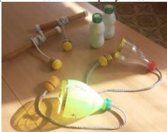
Моталочки. Бильбоке. Бутылочки с песком, вместо гантелей.