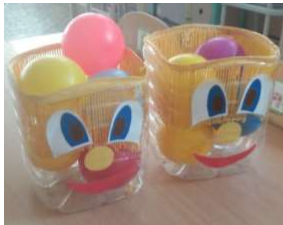
Корзина для мячей