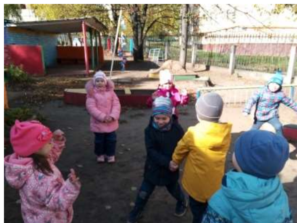
П/и «Земля, воздух, вода» (Шенгурова Е.В.)

- в течении года – Акция «Сдай использованные батарейки»