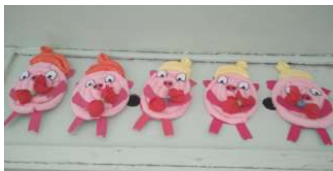
«Веселые поросята» (Алексеева Г.Р.)