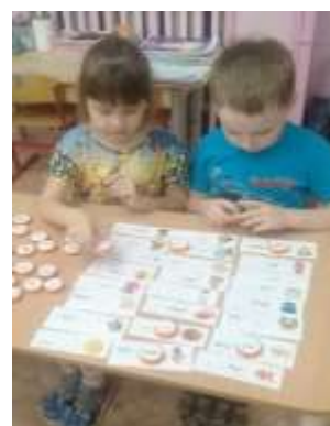
Чтение по крышкам